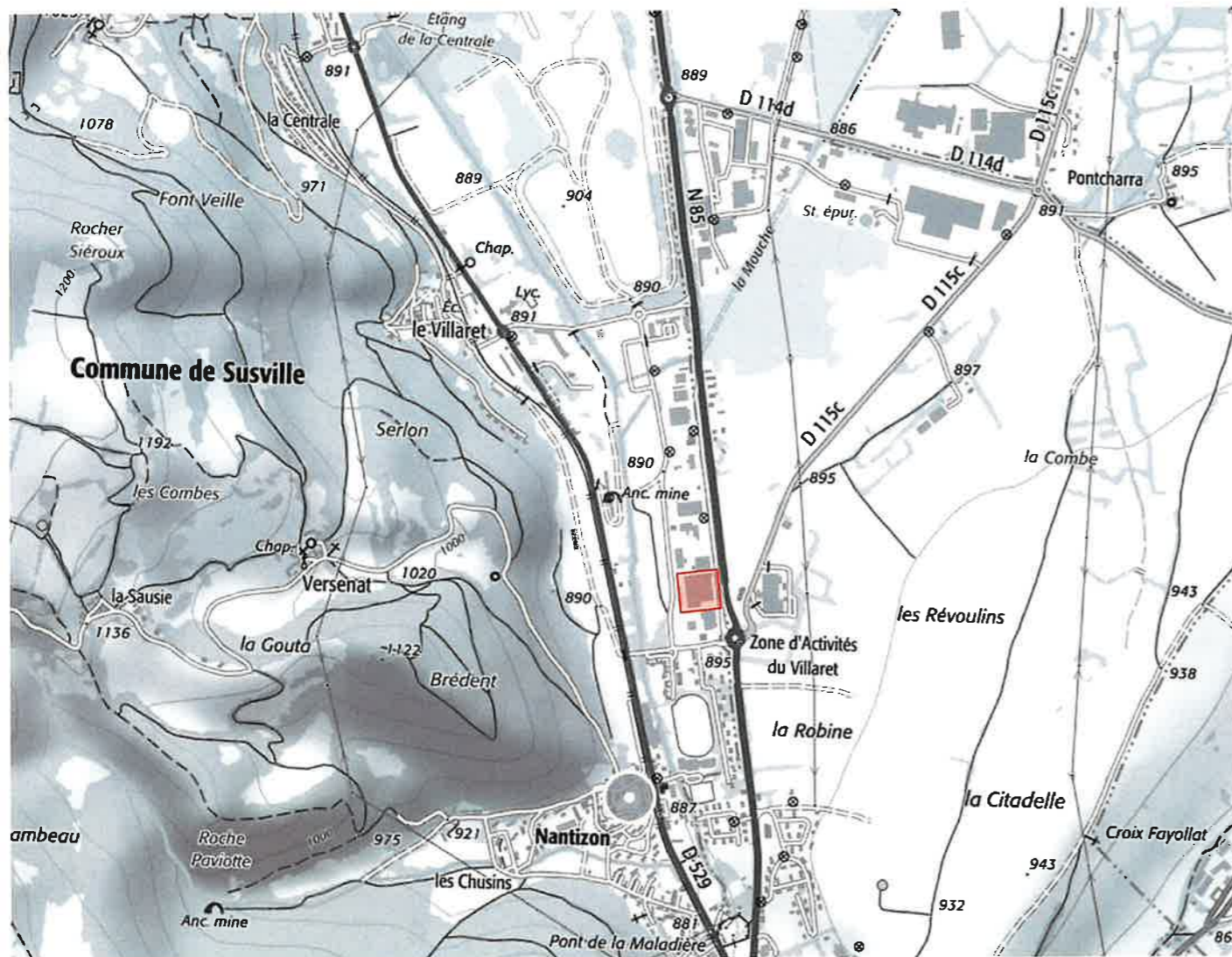
LOCALISATION SUR CARTE IGN ech 1/17000